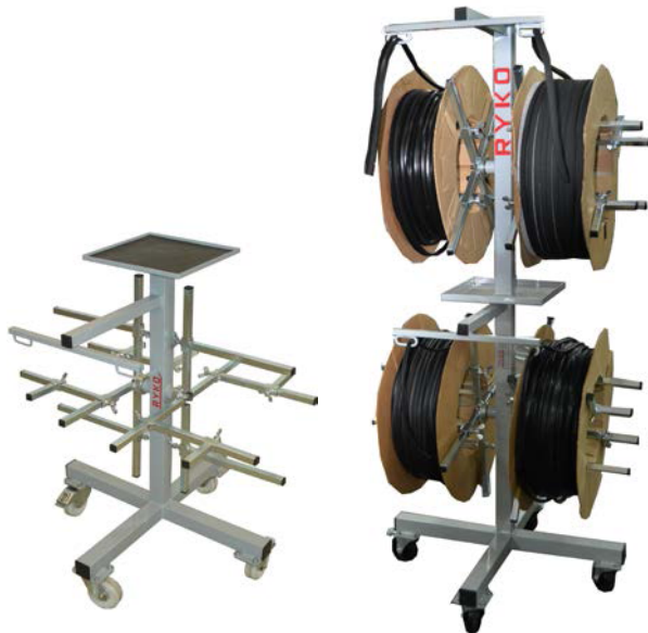
Haspelwagen HW1600 Haspelwagen HW1640