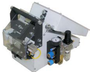
2084 – SA-MF2