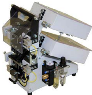
8323 – SA-MF2-2E