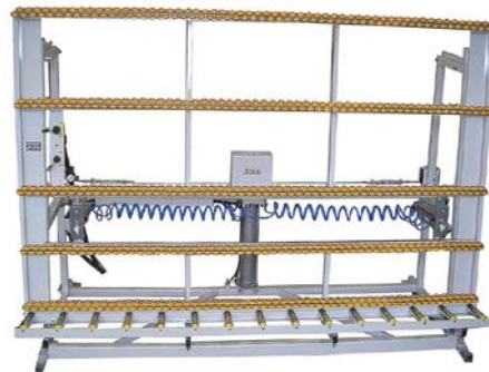
MS mit doppelter Gummirollenleiste als Anlagefläche MS with doubled rubber roller lath as contact surface