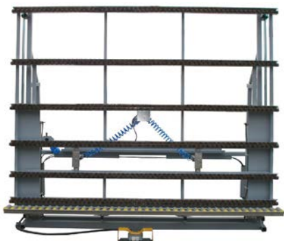
Montageständer mit doppelter Filzrollenleiste Assembly stand with doubled felt roller lath