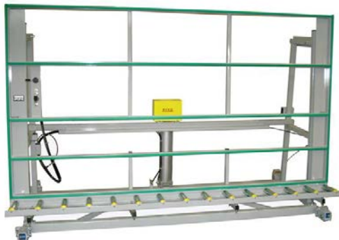
Montageständer MS mit Fahreinheit Assembly stand MS with drive unit