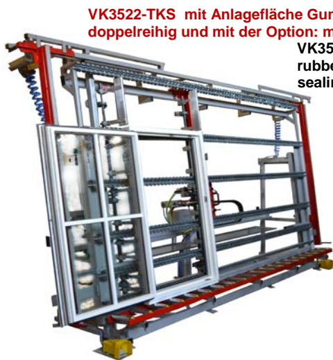
VK3522-TKS mit Anlagefläche Gummirollenleiste doppelreihig und mit der Option: mit Versiegelungs-Anschlag VK3522-TKS with contact surface rubber rollers doubled and option sealing bedstop system