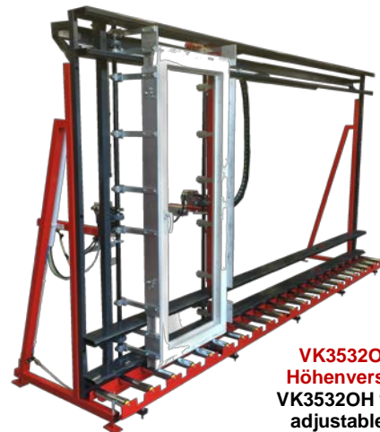
VK3532OH ohne Höhenverstellung VK3532OH without adjustable height