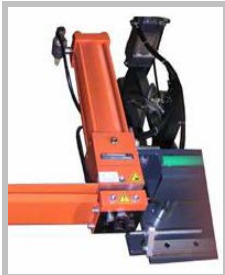
[1] Art.-Nr. 2748